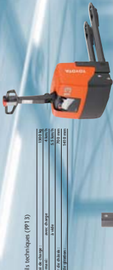
Détails technique (PP13)