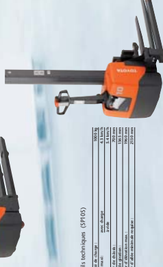
Détails technique (SP10S)